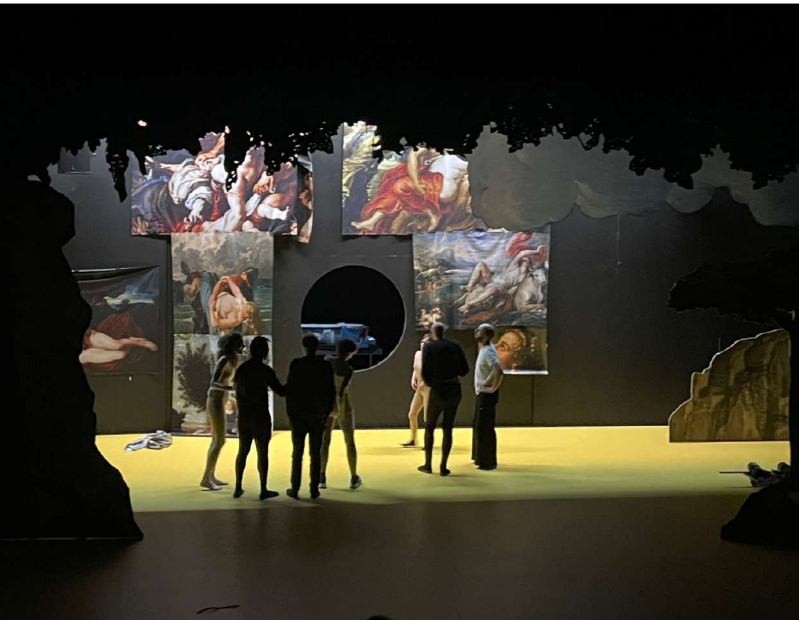
Photo de répétitions, MC2 Grenoble, juin 2026

C'est avec le surgissement de la parole que les acteur·ices entreprennent un deuxième round . De nouveaux objets sont sortis du trou, qui se désolidarise du mur du fond pour créer une nouvelle dynamique au plateau. Loin de la planéité de la première partie, c'est un espace qui permet une nouvelle circulation, et le châssis troué qui se détache du grand mur devient une sorte d'entresort forain, orné de rideaux rouges. Les objets qui encombrant alors l'espace, plus divers, en volume, gonflables et parfois absurdes recomposent un paysage beaucoup plus inventif, aux accents surréalistes, en référence à un mouvement qui ambitionnait de révolutionner profondément l'art, l'amour et la vie.