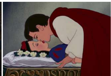
Blanche Neige et les sept nains Walt Disney, 1937