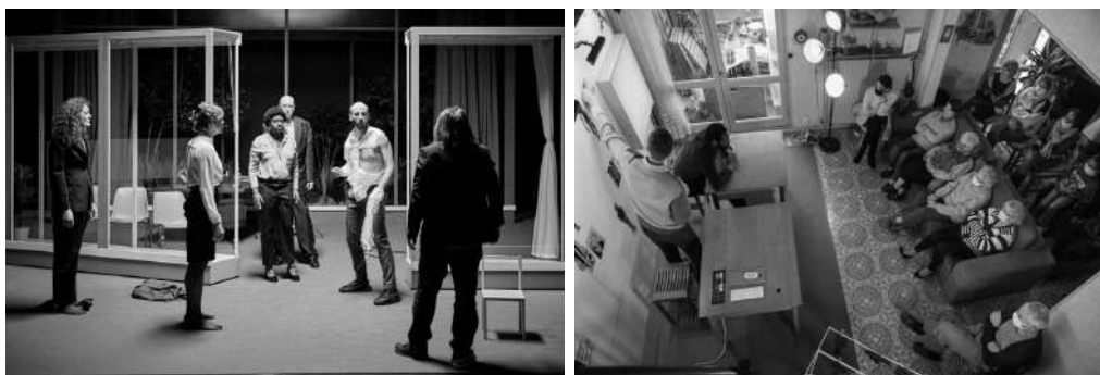
Les moments doux Pères (2021), représentation en appartement à Sevrans

En 2016, la création Ce qui demeure , ouvre un cycle de recherche et de création avec la même équipe. Suivront Saint-Félix, enquête sur un hameau français (2018) et A la vie ! (2020), créé à la MC:2 Grenoble. Ces trois pièces sont au répertoire et tournent à travers toute la France.