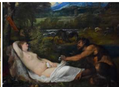
Jupiter et Antiope (détail) Le Titien, 1551