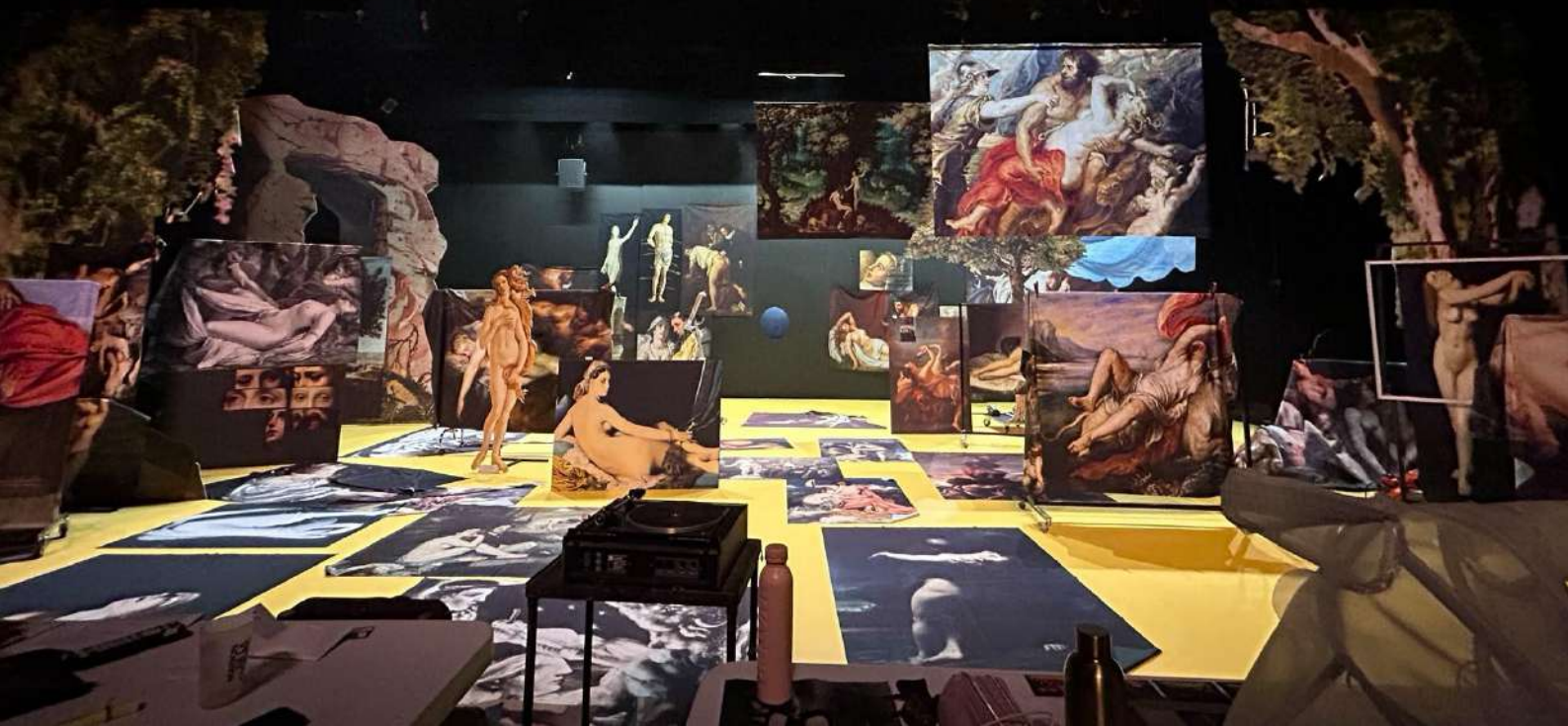
Photo de répétitions/ MC2 Grenoble/ juin 2026