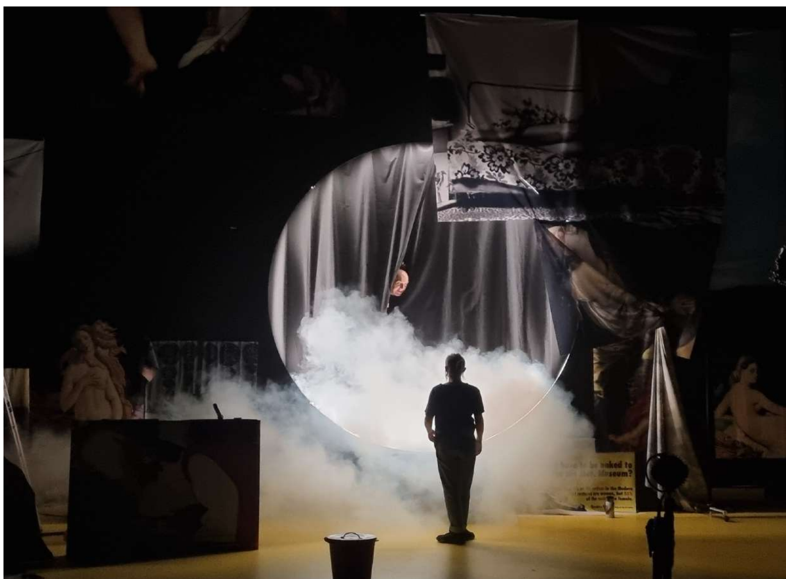
Photo de répétitions/ MC2 Grenoble/ juin 2026

Un langage s'invente propre à cette pièce et à ses enjeux pour dire ce qui en nous est indicible, révéler l'invisible des structures qui nous habitent et nous déterminent, trouver dans nos corps des chemins inconnus et désirables.