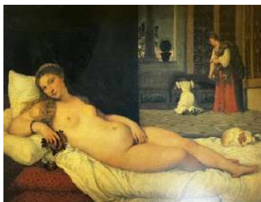
La Vénus d'Urbino Le Titien, 1538

En quoi ces représentations continuent-elles d'irradier nos intimités les plus profondes ?