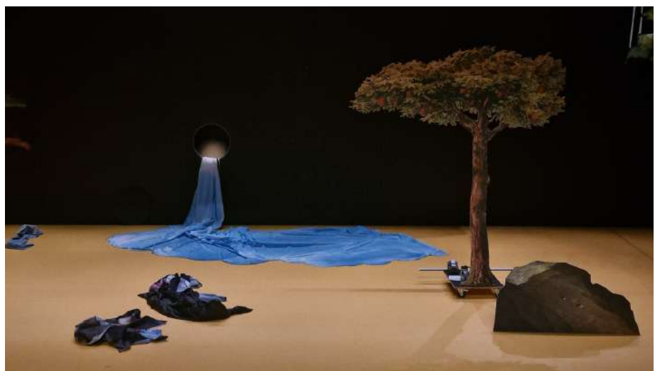
Photo de répétitions, MC2 Grenoble, juin 2026

Extrait adapté de l'histoire de Proserpine dans Les Métamorphoses d'Ovide